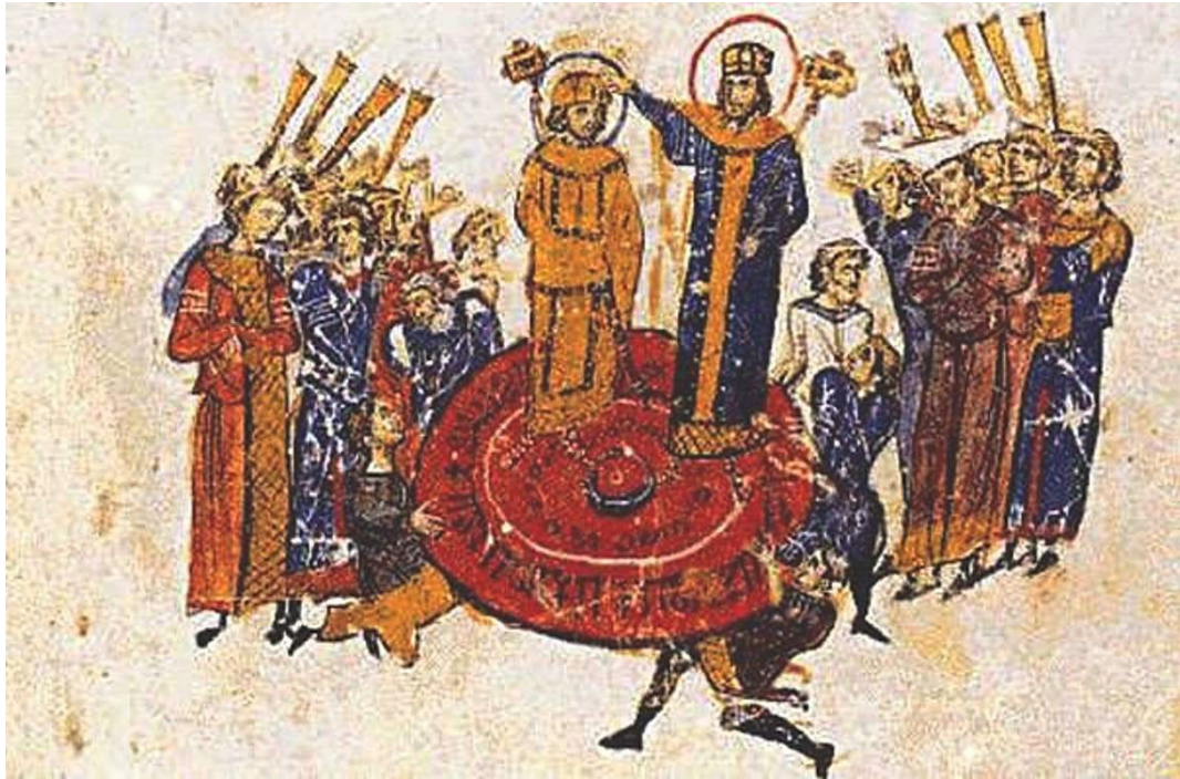
Εικόνα 1: 610 μ. Χ. - Ο Ηράκλειος γίνεται αυτοκράτορας του Βυζαντίου