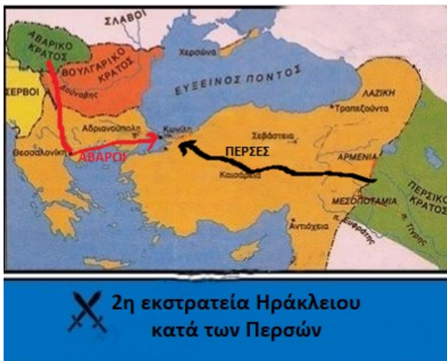
Εικόνα 12: Άβαροι και Πέρσες πολιορκούν την Πόλη

ενώ ο Ηράκλειος βρισκόταν στην Περσία, οι Πέρσες + Άβαροι συνεννοούνται και πολιορκούν την Πόλη από στεριά και θάλασσα