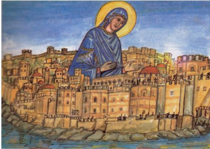
Εικόνα 13: Οι Βυζαντινοί νικούν