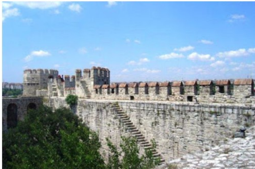
Εικόνα 6: Επισκεύασε τα τείχη