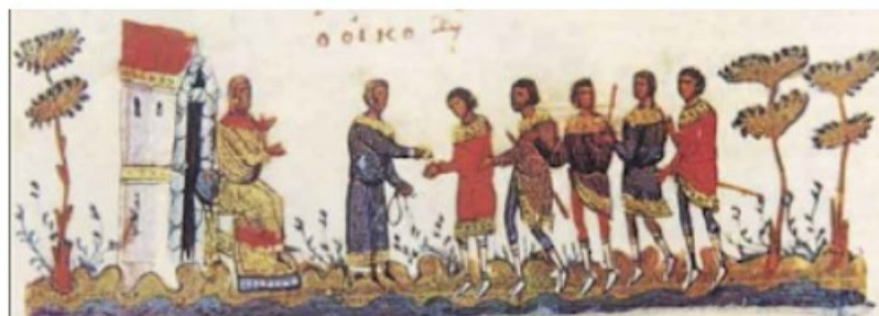
Εικόνα 7: Συγκέντρωσε εφόδια και τροφές για τους κατοίκους της Πόλης