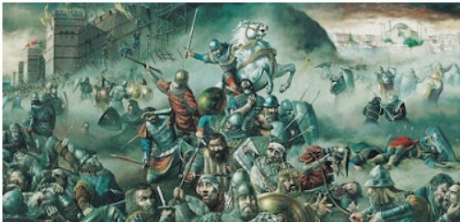
Εικόνα 10: Ο Ηράκλειος στρέφεται κατά των Περσών