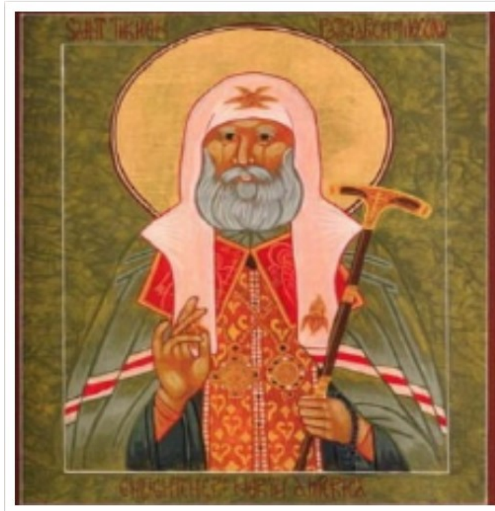
Εικόνα 3: Πατριάρχης Σέργιος

«έδωσε τα χρήματα της εκκλησίας ως δάνειο στο κράτος. Πήρε τα πολυκάντηλά και τα άλλα χρυσά σκεύη από τη Μεγάλη Εκκλησία, τα έδωσε στον αυτοκράτορα κι αυτός τα έκοψε νομίσματα».