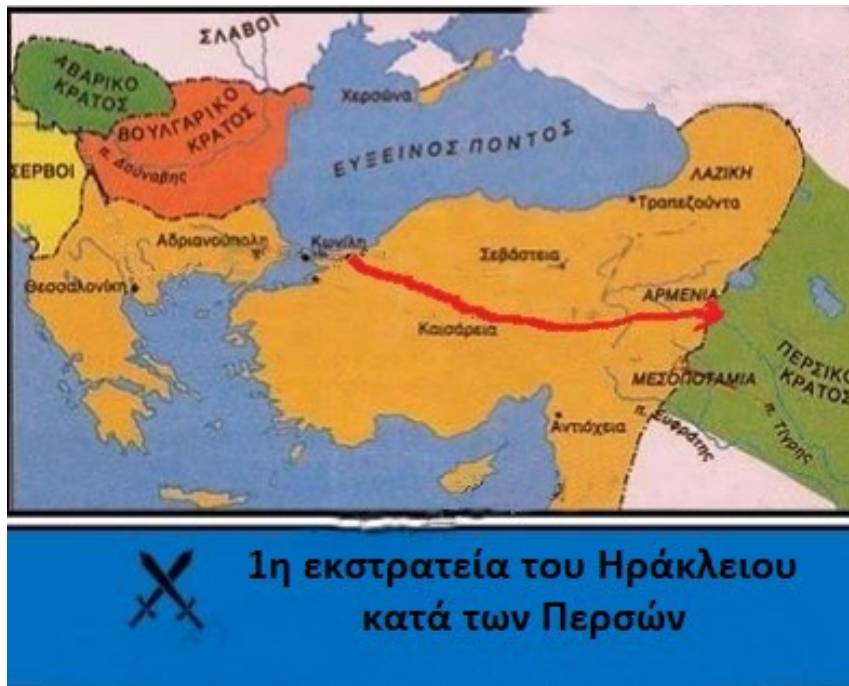
Εικόνα 11: 1η εκστρατεία κατά των Περσών

πέτυχε οι Πέρσες να επιστρέψουν στην Περσία εγκαταλείποντας Μ. Ασία