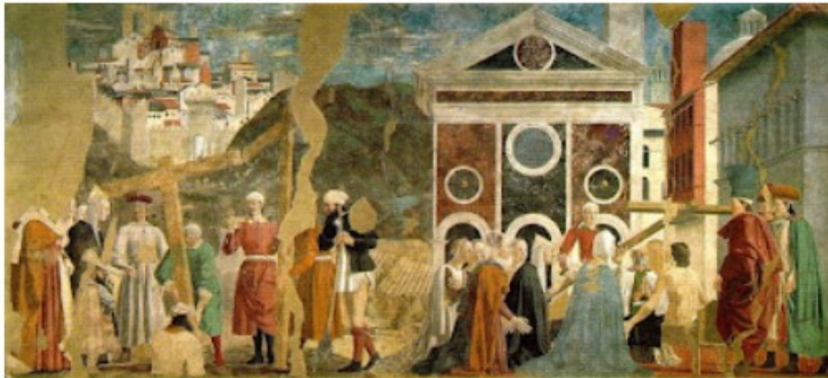
Εικόνα 9: Ο Χοσρόης, βασιλιάς των Περσών, μεταφέρει τον Τίμιο Σταυρό στην Κτησιφώντα