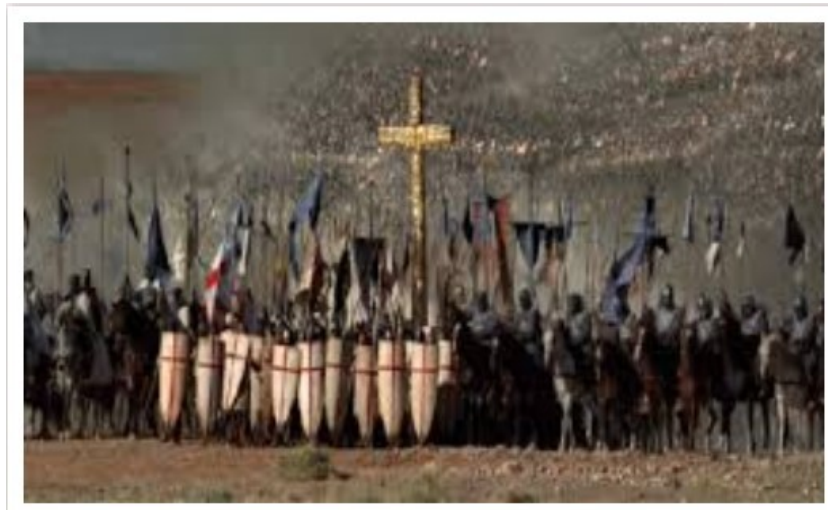
Εικόνα 14: Επιστροφή Τίμιου Σταυρού

Ο Ηράκλειος, ενθαρρυμένος, παίρνει τον Τίμιο Σταυρό και νικά τους Πέρσες