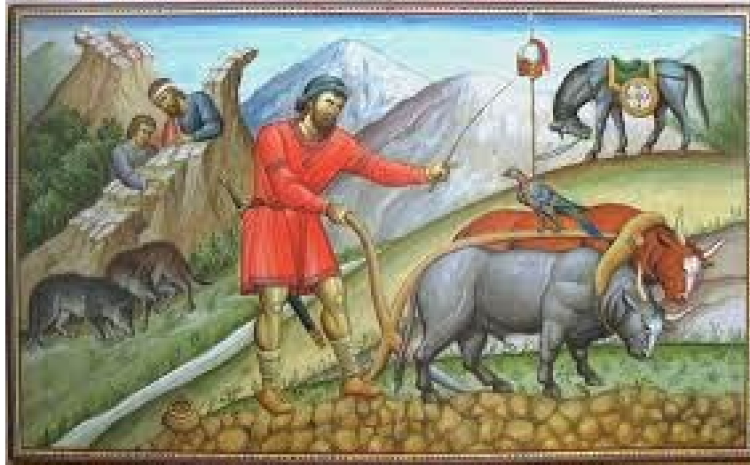
Εικόνα 5: Μοίρασε γη στους στρατιώτες των συνόρων