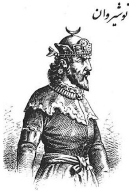
Εικόνα 8: Έκλεισε ειρήνη με Χαγάνο, αρχηγό των Αβάρων