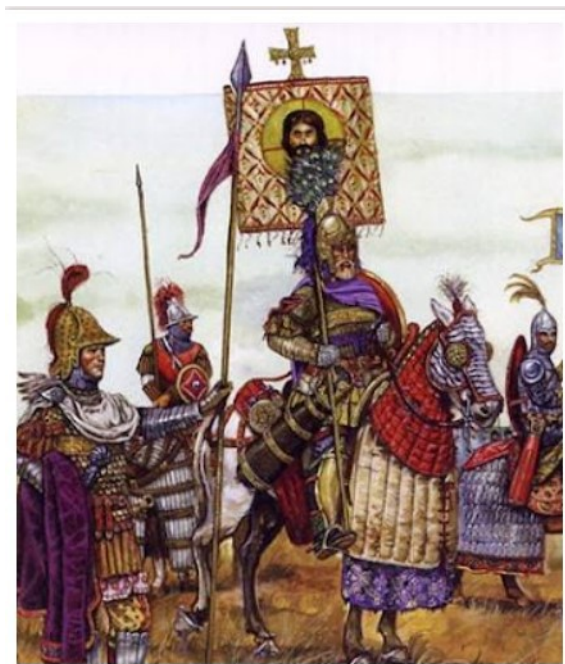
Εικόνα 4: Οργάνωσε τον στρατό