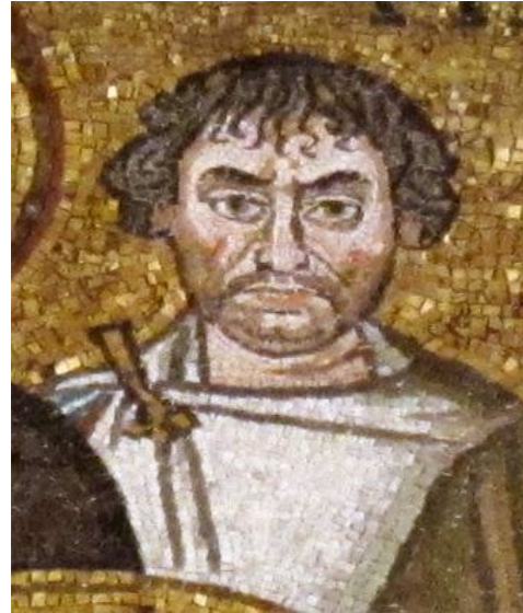
Βελισάριος και Ναρσής