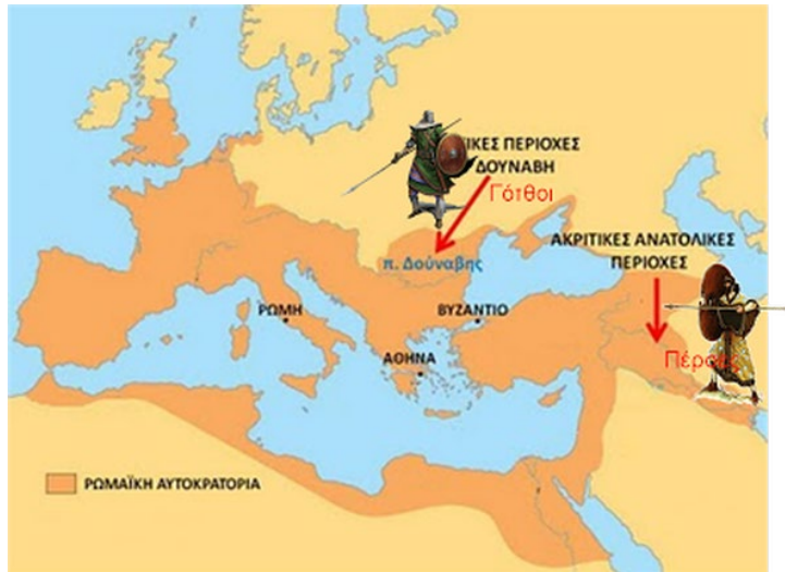
Πέρσες και Γότθοι

Ο Ιουστινιανός υπέγραψε συνθήκες ειρήνης με τους λαούς στο Δούναβη και με τους Πέρσες στην Ανατολή, δίνοντάς τους πολλά χρήματα.