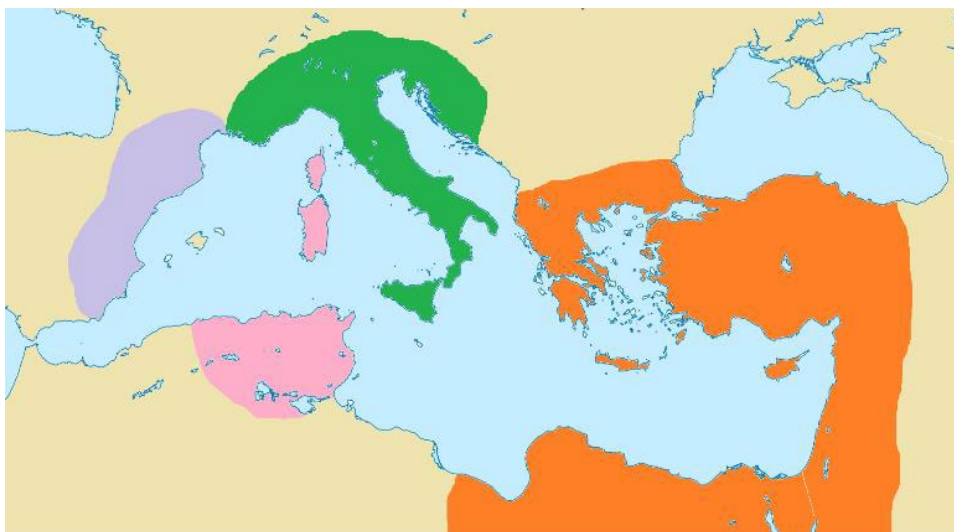
Το Βυζάντιο πριν τον πόλεμο

Βοήθησαν να γίνουν στις δυτικές επαρχίες μεγάλα έργα ισάξια με εκείνα της Πόλης.