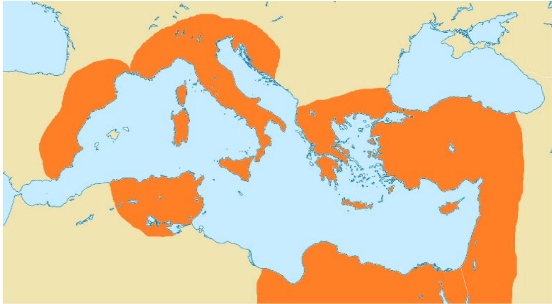
Το Βυζάντιο μετά τον πόλεμο