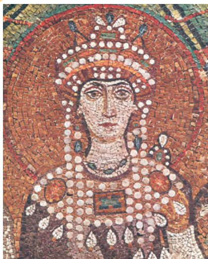
3. Η αυτοκράτειρα Θεοδώρα. (Ψηφιδωτό από τον Άγιο Βιτάλιο, Ραβέννα)