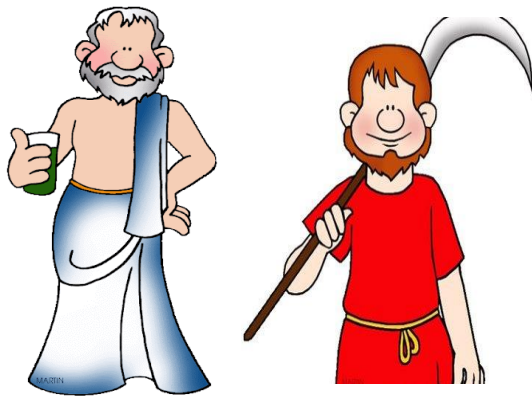
Ο Ιουστινιανός είπε στους μεγαλοκτηματίες (πλούσιοι) να μην παίρνουν τα χωράφια των μικροκτηματιών (φτωχοί).