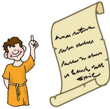
Ο Ιουστινιανός έγραψε νέους νόμους