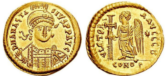
Ο Ιουστινιανός έκοψε χρυσά νομίσματα