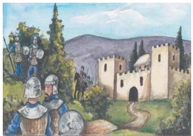
Ο Ιουστινιανός έφτιαξε δυνατό στρατό. Οι στρατιώτες φυλούσαν τα σύνορα του Βυζαντίου.